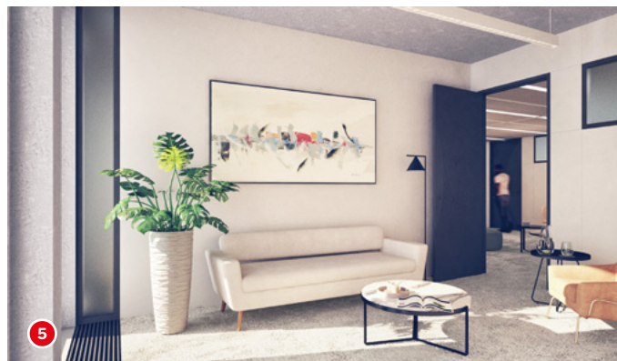
1. Atrium 2. Bureaux 3. Coffee corner du Centre de formation 4. Coffee & Concept Store 5. Espace de consultation